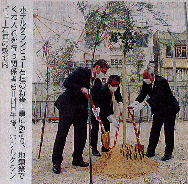
ホテルグランビュー石垣の新築工事にあたり、地鎮祭でくわ入れを行う関係者らⅡ14日午後、ホテルグランビュー石垣の敷地内